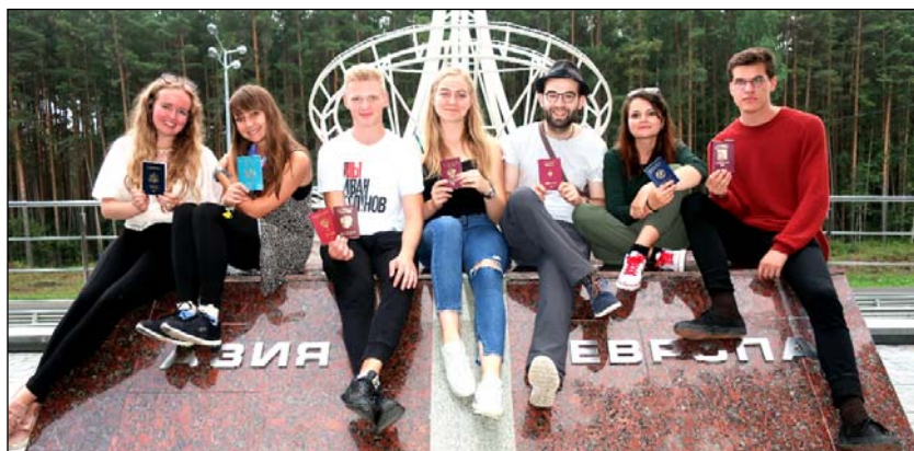
Im Ural auf der Grenze zwischen Asien und Europa. Jugendliche aus (v.l.) USA, Kasachstan, Russland, Polen, Deutschland, Belarus und Tschechien bei der Jugendbegegnung 2019 organisiert von der Aktion West-Ost.