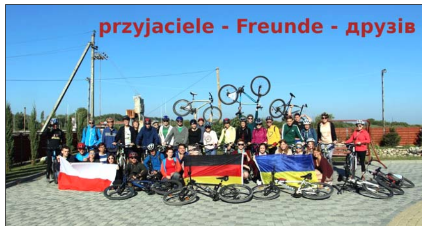
Frohe Stimmung bei der DE-PL-UA-Jugendbegegnung in der Ukraine 2017 unter dem Motto: By Bicycle Through Europe