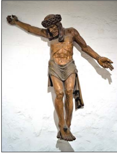
Aus der Erde auferstanden - eine Christusfigur vom Gothaer Bildhauer Victor Embser im Erfurter Dom.

Bei einer monumentalen Kreuzigungsgruppe des Erfurter Domes fehlte die Darstellung des Cruzifixus. Johannes und Maria, zwei gotische Skulpturen von jeweils über zwei Meter Größe, sollten im Jahr 1939 durch eine neue Darstellung des Gekreuzigten ergänzt werden. Der Gothaer Bildhauer Victor Embser wurde dazu beauftragt. Im Sommer 1939 stand jedoch der 2. Weltkrieg bevor. Im Protokoll des Dompropstes ist zu lesen: „Man merkte schon, dass etwas in der Luft liege.“ Es fehlte sogar an Holz, das dann doch noch für das monumentale Schnitzwerk beschafft werden konnte. Der Bildhauer wurde jedoch während seiner Arbeit am Christuskorpus durch die Regierung für andere Arbeiten dienstverpflichtet und Bombenangriffe machten die weitere Arbeit